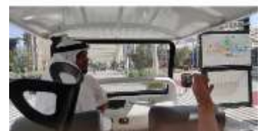
I padiglioni: Italia